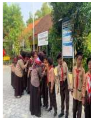
Gambar 3. Lomba membuat poster dan pembagian pin anti bullying dan anti pelecehan seksual pada anak di SDN 25 Gresik.