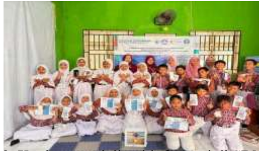
Gambar 2. Kegiatan sosialisasi informasi di SDN 25 Gresik.

Kegiatan sosialisasi pengetahuan dan perilaku anti bullying dan perlindungan dari pelecehan seksual selanjutnya adalah mengedukasi adik-adik kelasnya. Semua siswa dokter kecil dan guru menyebarkan informasi yang mereka dapatkan dari edukasi ini.