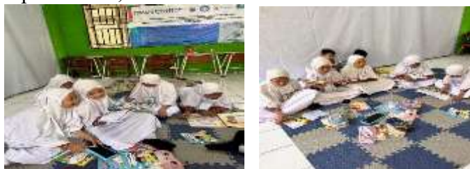
Gambar.1 Literasi peserta siswa dokter kecil di SDN 25 Gresik

Ada 14 buku yang disumbangkan tim abdimas untuk kegiatan literasi ini, dimana seluruh judul terkait dengan topik Anti Bullying dan Perlindungan dari pelecehan seksual. Dari hasil kegiatan literasi ini dapat dievaluasi bahwa hasil didapatkan seluruh peserta literasi menyatakan penting membangkitkan pengetahuan anak tentang tubuh kita berharga, penting mengetahui pubertitas pertama dan tubuh harus dilindungi, perlunya berani menolak bullying dan berani tidak melakukan bullying, pentingnya berteman dan hidup bersosial,