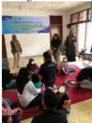
Gambar 1. Kegiatan Anak – Anak Mendengarkan Dongeng

Kegiatan ini dilakukan selama 1,5 jam di Yayasan Akbar, pada kegiatan ini petugas lapangan mencobakan kegiatan berdongeng kepada anak – anak dengan HIV/AIDS menggunakan buku dongeng “Bubu dan Biji Ajaib” serta boneka tangan.