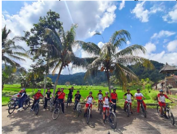
Gambar 12. Pendampingan cara penggunaan aplikasi website

untuk menggunakan aplikasi mobile . Adapun dokumentasi kegiatan sebagai berikut: