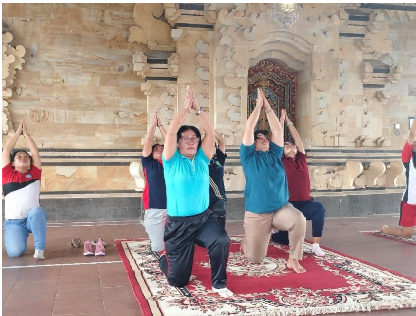
Gambar 5. Demonstrasi Wisata Spiritual