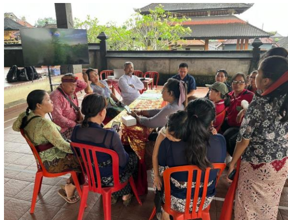
Gambar 8. FGD Desa Wisata Spiritual

d. Menyusun media promosi wisata spiritual desa wisma kerta sebagai upaya keberlanjutan program