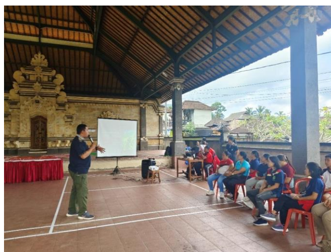
Gambar 11. Pelatihan dan demonstrasi penggunaan aplikasi website

Pada tahap kedua kegiatan, peserta dilatih dalam mengelola website desa wisata spiritual . Selama kegiatan pelatihan umum, peserta dibantu oleh mahasiswa Prodi Keperawatan Fakultas Kedokteran Universitas Pendidikan. Ganesha. Peserta sangat antusias mengikuti pelatihan tentang aplikasi website desa wisata spiritual . Peserta Pokdarwis menilai bahwa pengetahuan yang mereka peroleh adalah pengetahuan baru dalam meningkatkan keselamatan wisatawan. Saat pelatihan setiap peserta diminta untuk mencoba secara langsung mengoperasikan aplikasi website desa wisata spiritual . Peserta Pokdarwis yang telah berhasil masuk ke website desa wisata spiritual , selanjutnya diberikan petunjuk untuk mengelola dan manajemn layanan desa wisata spiritual . Berikut adalah dokumentasi pelaksanaan pelatihan dan demonstasi penggunaan aplikasi website desa wisata spiritual :