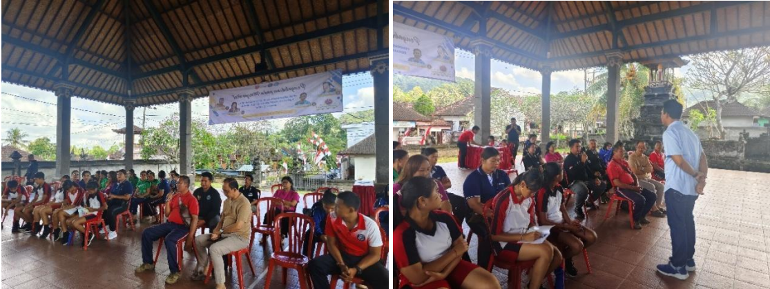
Gambar 10. Sosialisasi penggunaan website

pengetahuan anggota Pokdarwis tentang aplikasi website desa wisata spiritual . Setelah itu, penyampaian materi oleh narasumber. Narasumber memberikan sosialisasi aplikasi website desa wisata spiritual dengan metode ceramah dan diskusi. Materi yang disampaikan berkaitan dengan penggunaan aplikasi website desa wisata spiritual . Peserta diberikan tips dalam menggunakan, menginstal aplikasi website desa wisata spiritual . Setelah penyampain materi dilanjutkan dengan sesi diskusi dan tanya jawab. Peserta diberikan kesempatan untuk menanyakan tentang aplikasi website desa wisata spiritual dan implementasinya dalam pelayanan wisata bahari. Berikut adalah penyampaian materi aplikasi website desa wisata spiritual dan implementasinya dalam pelayanan wisata bahari oleh narasumber.