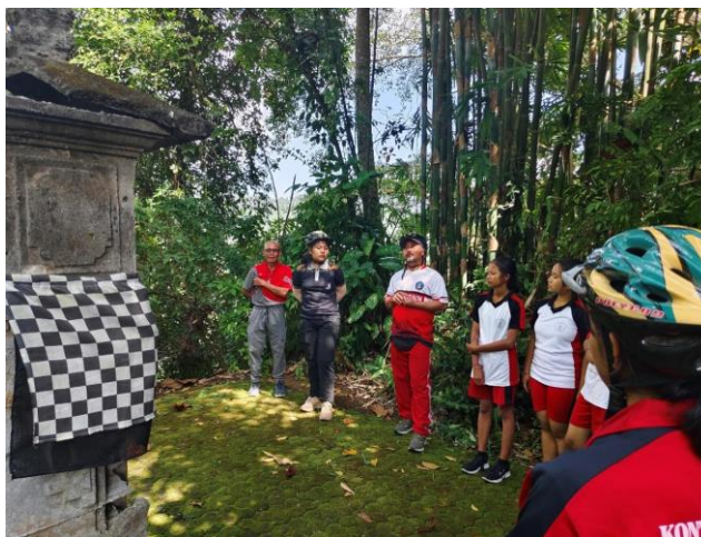
Gambar 6. Pendampingan wisata spiritual

Tahap ketiga kegiatan pengabdian kepada masyarakat ini adalah kegiatan pendampingan dan evaluasi. Pada kegiatan ini tim bersama anggota Pokdarwis terlibat dalam kegiatan tracking untuk selanjutnya tim melakukan pendampingan dan diskusi terkait wisata spiritual yang sudah diberikan sebelumnya. Tim juga melakukan evaluasi peningkatan aspek kognitif ( post test ) pada peserta terkait wisata spiritual. Adapun dokumentasi kegiatan pendampingan dan evaluasi sebagai berikut: