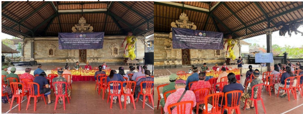
Gambar 4. Acara Pembukaan dan Pelatihan Wisata Spiritual

diberikan langkah-langkah dalam memberikan layanan wisata spiritual. Setelah penyampaian materi dilanjutkan dengan sesi diskusi dan tanya jawab. Peserta pelatihan diberikan kesempatan untuk bertanya tentang wisata spiritual dan implementasinya dalam pelayanan wisata spiritual. Berikut adalah penyampaian materi wisata spiritual dan implementasinya dalam pelayanan wisata spiritual.