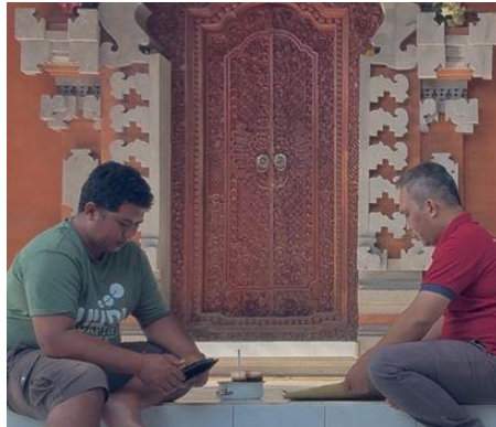
Gambar 3. Survey dan peninjauan dengan Mitra

Potensi ini belum disadari akibat belum adanya dukungan dan pembinaan dari pihak terkait seperti pemerintah desa, lembaga pengembangan ekonomi, dan organisasi non-pemerintah, dalam meningkatkan ekonomi masyarakat desa melalui pengembangan sektor pariwisata khususnya wisata spiritual. Pokdarwis Dusun Klungah di Desa Wisma Kerta menjadi sasaran yang potensial mengingat anggota Pokdarwis yang merupakan pelaku wisata di daerah Wisma Kerta. Kelompok ini memiliki keinginan mengembangkan desa Wisma Kerta sebagai desa wisata khusus spiritual melihat potensi desa untuk membantu ekonomi masyarakat dan keluarga. Namun, kelompok ini masih terbatas dalam pengetahuan dan keterampilan dalam mengelola usaha pariwisata secara efektif dan berkelanjutan. Selain itu, untuk mengembangkan ide usaha anggota Pokdarwis menghadapi kendala dalam hal sumber daya dan sarana prasarana yang diperlukan untuk mempromosikan wisata Wisma Kerta.